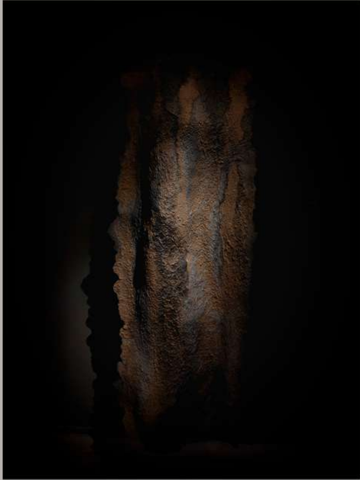
RETAZO DE MONTES 519 7148

“RESISTEN EL ECOCIDIO Y LA RAPIÑA AMBIENTAL DE CARA A LA IMAGINACIÓN DE OTRAS CONDICIONES POSIBLES” (T.E.)